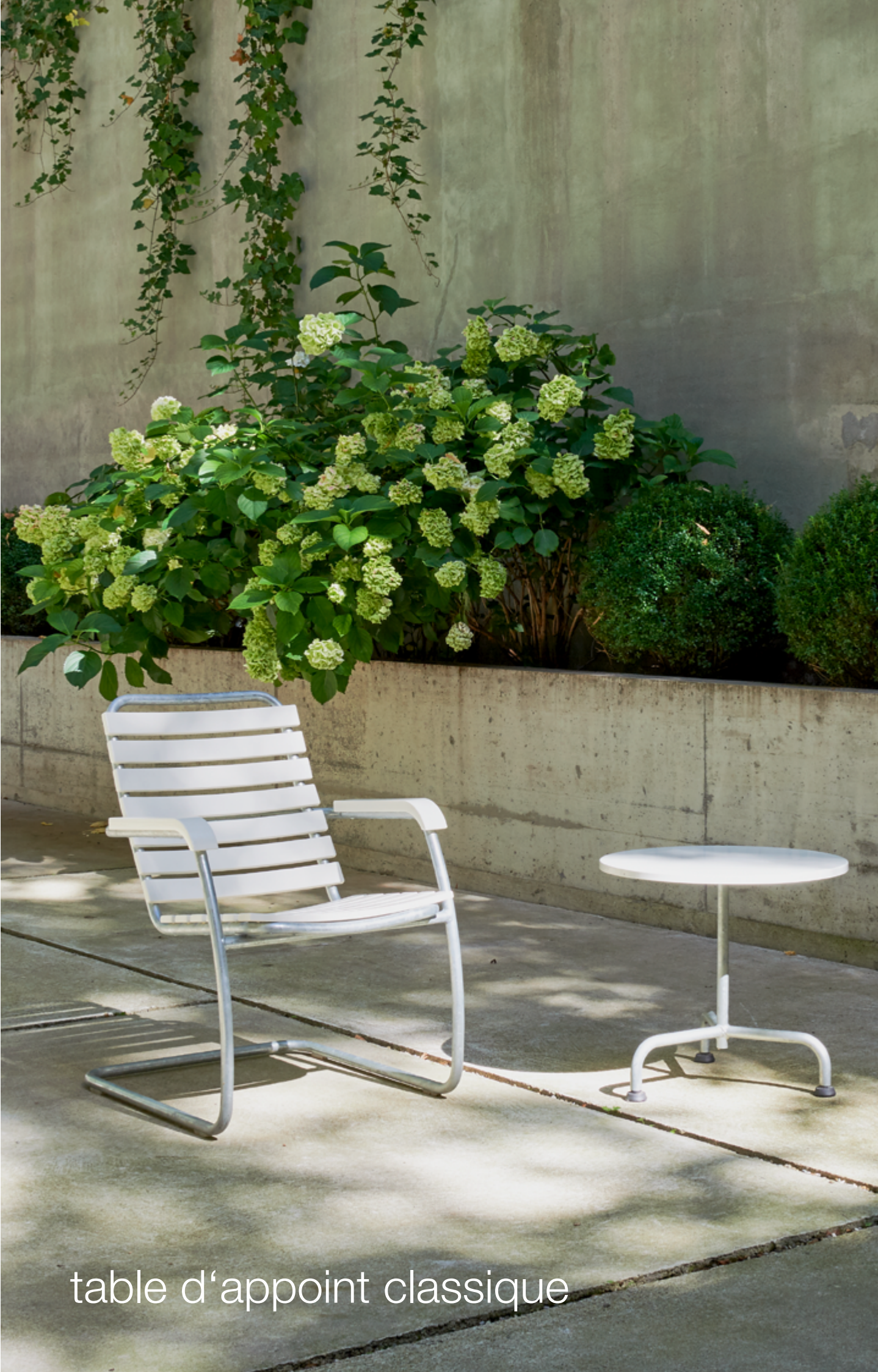
table d'appoint classique