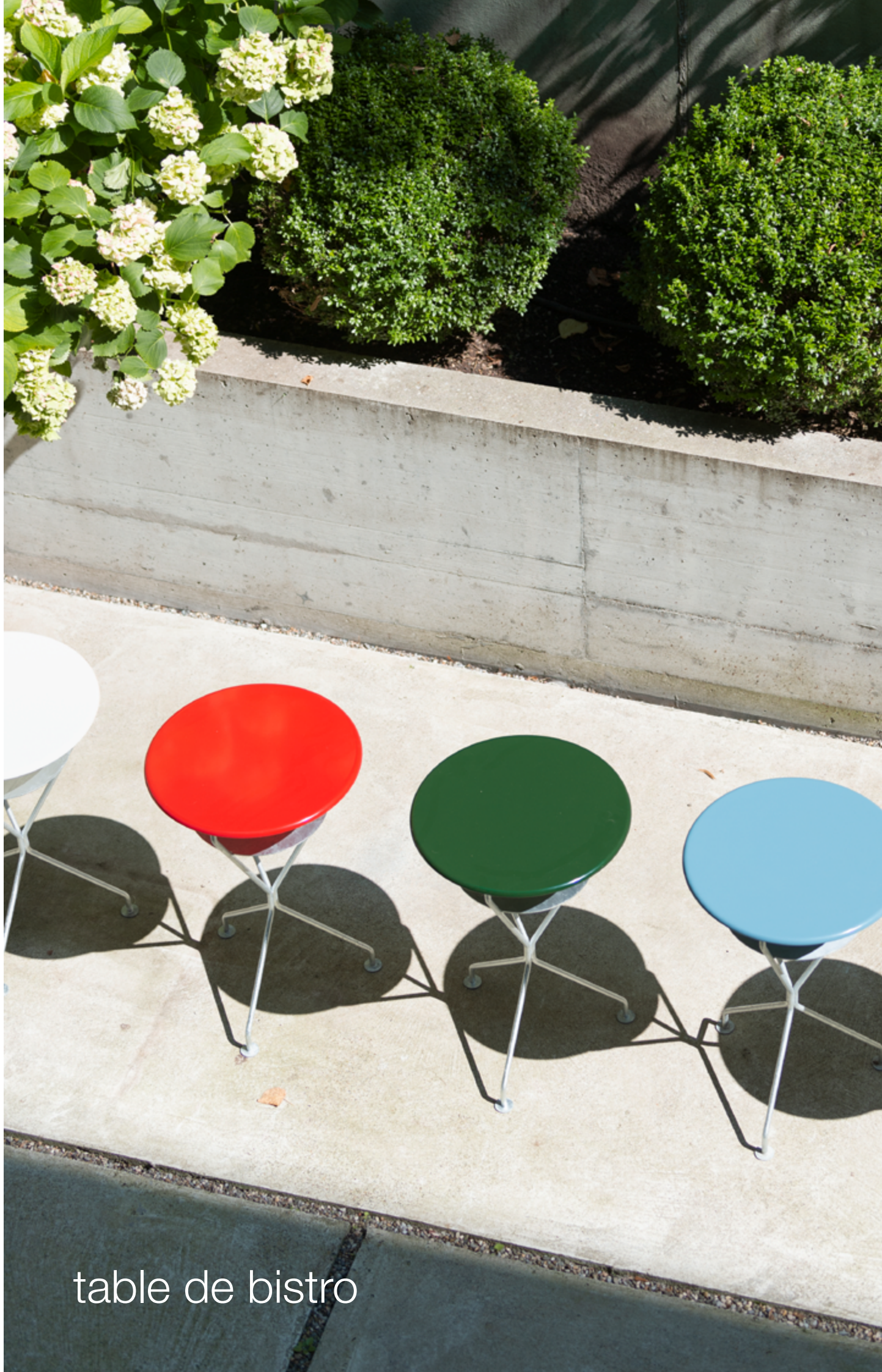
table de bistro